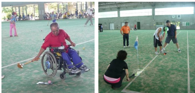
会場の様子、車いす用クラブ・視覚障害のガイド