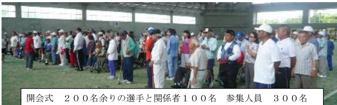
開会式 200名余りの選手と関係者100名 参集人員 300名

なお、今大会の優勝チーム「沖縄市身障協 聴覚部会チームA」は、今年10月19日熊本県で開催される第6回九州身体障害者グランド・ゴルフ大会への出場権を得ました。