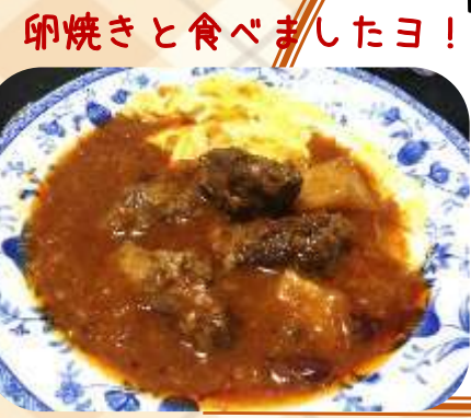
卵焼きと食べましたヨ!

開封して最初に驚かされたのは【具の大きさ】!お肉と野菜がゴロゴロと入っていて肉好きには堪らなりました!!しかもお肉の食感がばっちり残っていて食べ応え抜群♪味付けもトマトベースであっさり!ペろり☺️と完食。また食べたくなる一品でした。