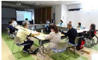
市町村身体障害者協会会長及び事務担当者会議