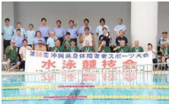
第58回 沖縄県身体障害者スポーツ競技会 (水泳)