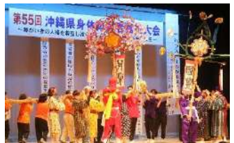
第55回沖縄県身体障害者福祉大会