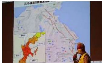
令和4年度障がい者福祉講演会