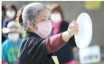
第58回 沖縄県身体障害者スポーツ競技会 (フライングディスク)