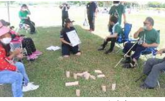
チャリティーマルック大会