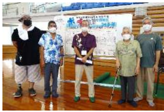
令和4年度沖縄県身体障害者ポッチャ教室