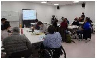
令和4年度 基礎研修