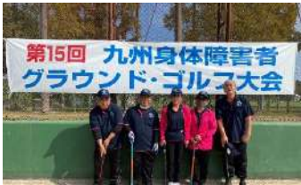
第15回九州身体障害者グラウンド・ゴルフ大会