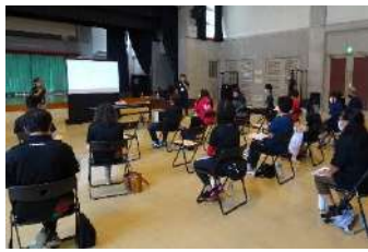
令和4年度沖縄県障害者スポーツサポーター養成講習会